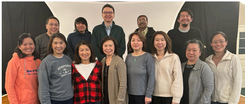
牛頓 Alpha 啟發課程