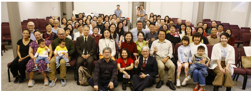
(上) 青少年團體聚會 (下) 十年公理慶典合影

感謝主使用我們在牛頓國語群體 為祂作見證!求主托着弟兄姊妹能 繼續忠心按恩賜事奉, 在未來的 歲月中使這堂會成為更合神心意 和健康的堂會, 榮神益人! 阿們!