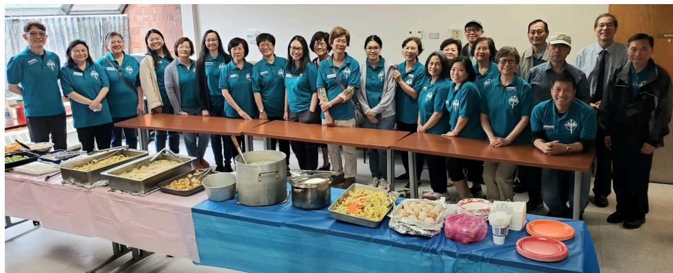
(左上) 慶祝農曆新年 (右上) 中文青少年團契活動 (下) 司提反同工與畢業學員及嘉賓合照