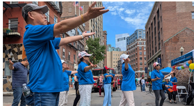
中秋節手語舞敬拜

我們教會國語事工經歷異端東方閃電第三波滲透，考驗對神的道是否清楚分辨異端與真道。我們感謝主，在團契與主日學，無論預備查經討論，或團契查經，都可以感受到神的話火熱我們的心，讓我們警醒悔改，保持謙卑，在苦難中仰望神。同時團契敬拜嘗試以手語舞，將讚美與詩歌活潑表達出來，在野外讚美神，在唐人街中秋攤位讚美神。這也是疫情後生命的反思與反省，讓我們更加珍惜基督肢體互相勸勉激勵的寶貴時光，也為著能夠一起面對面互相提攜，一起走過末世艱難大時代而深深感恩。