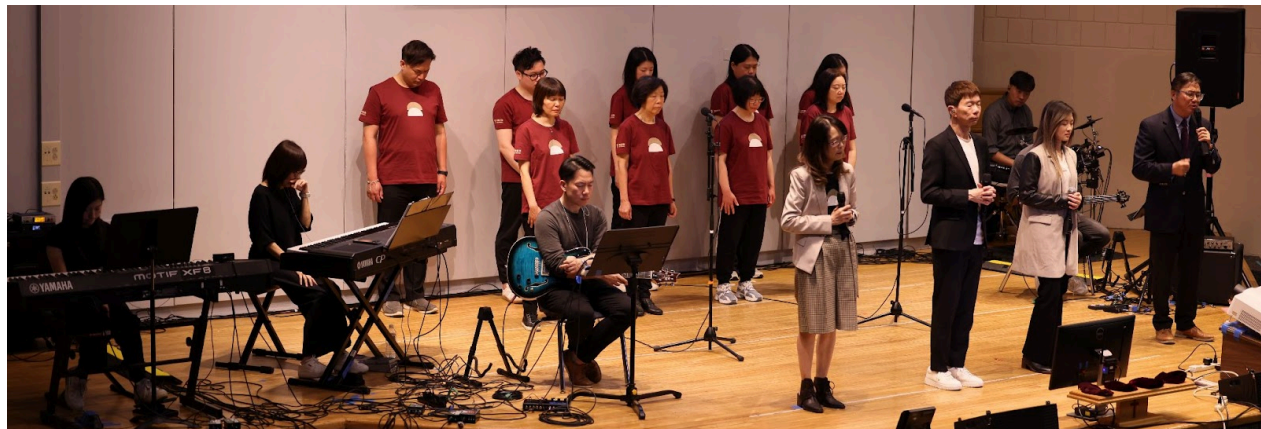
(上) 華埠粵語崇拜聚餐 (下) 角聲使團主領崇拜