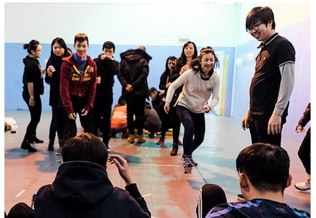
約書亞二團 (粵語大學生團契) 小型冬令會 (2/10-2/12)