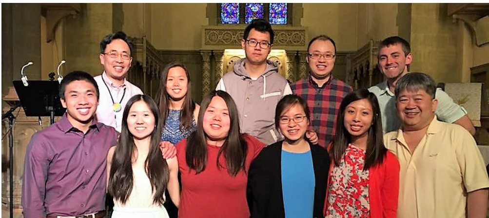
牛頓英文堂：復活節主日崇拜 (4/16)