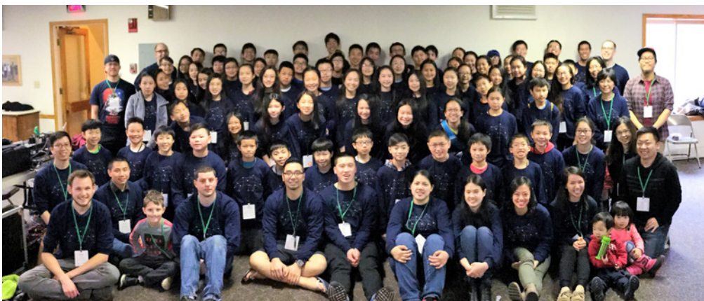
英文初中生青少年冬令會 (2/24-2/26)