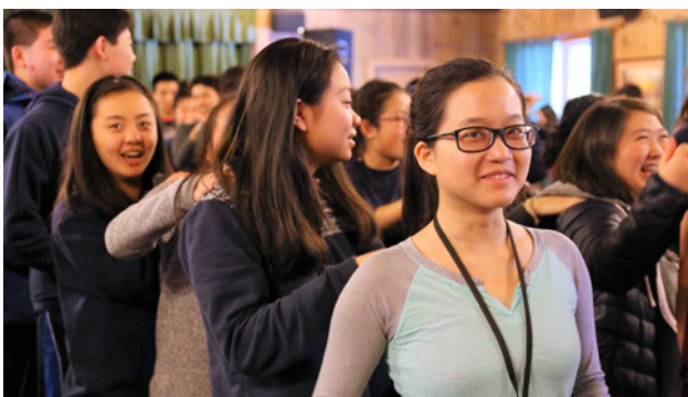
英文高中生青少年冬令會 (2/17-2/20)