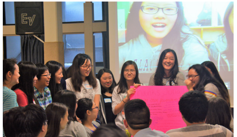
青少年事工致謝晚宴 (4/29)