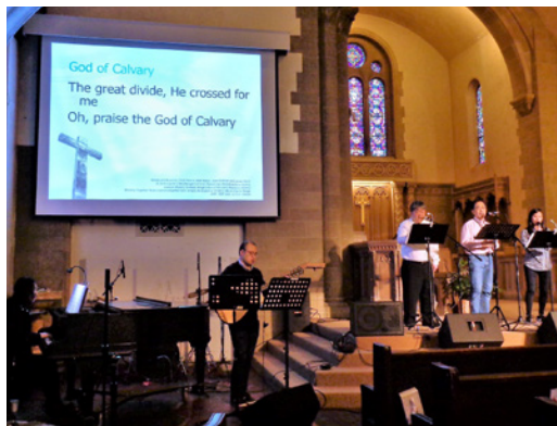
華埠英文堂及牛頓英文堂復活節主日崇拜 (4/1)