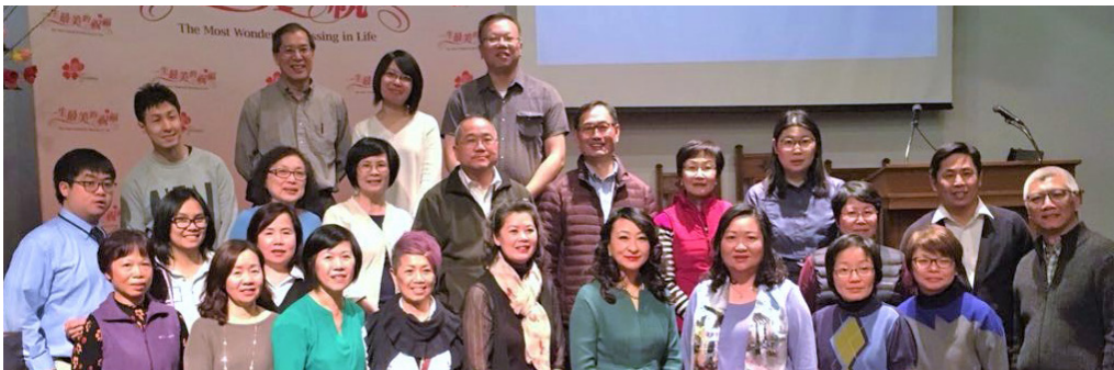
與香港「愛基金」聯合舉辦，名為「一生最美的祝福」的音樂佈道會 (4/13)