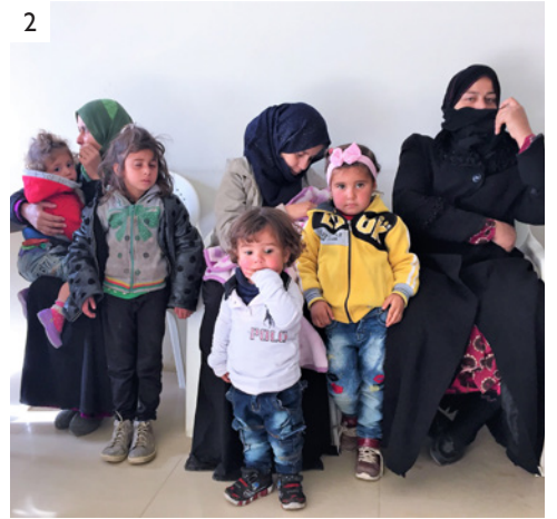
1) 黎巴嫩教會內的難民兒童學校