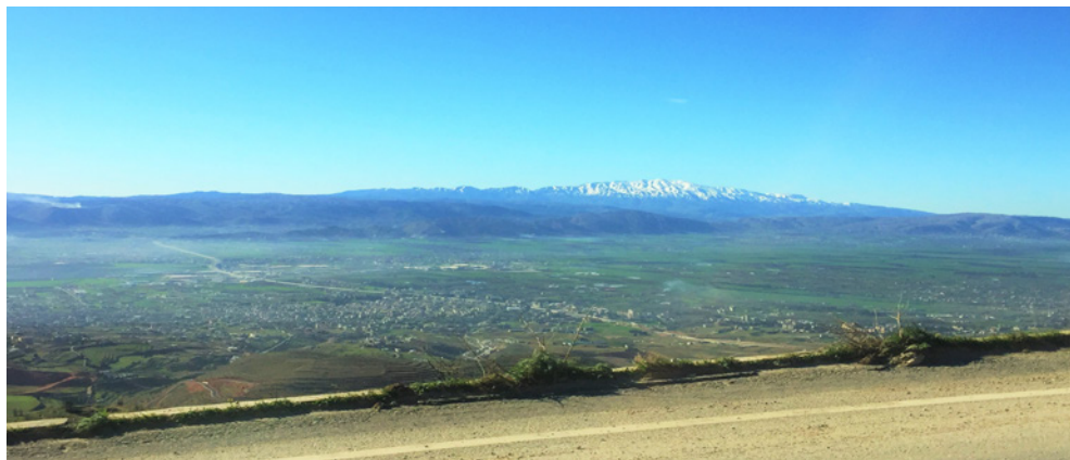
黑門山和黎巴嫩的貝卡谷地

享父神怎樣用大能的手，感動不同的人，在難民危機爆發前預備他們的教會，怎樣藉教會收容和關顧湧進黎巴嫩的難民。那所蒙大恩的教會，透過社區服務、開設學校、醫療中心等，正支援3,100個因戰爭而到來的難民。若平均一個家庭有七位成員（因回教徒一般生養眾多，有五個孩子以上的家庭比比皆是），他們正每天關顧二萬多個有需要的人。我看見他們的同工每天聚集在社區服務中心內，先禱告，後分頭作醫療服務、運送糧食物資、探訪難民和帶領門徒訓練小組等。眾人齊心努力完成主所託的愛心服侍和傳福音的工作，非常感人！主啊！求你大大加力給當地的教會，使他們為你發光發熱，撫平受苦大眾的心靈，得著生活的溫飽和認識你對他們每一位的愛！