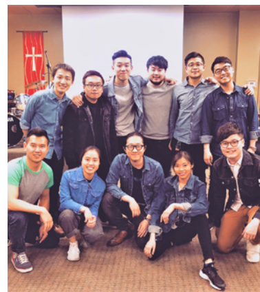
約書亞二團 (粵語大學生團契) : Love Goes On 音樂會 (4/7)