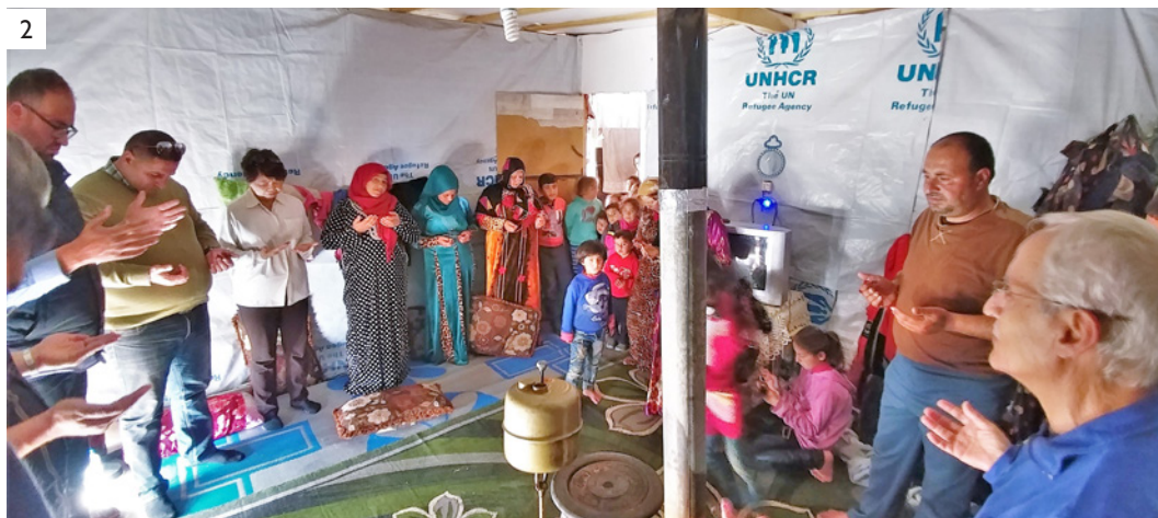
1) 黎巴嫩教會——神預備他們接待難民 2) 為敘利亞難民及其家人祈禱及祝福