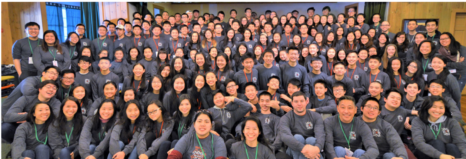
英文高中生青少年冬令會 (2/16-2/19)