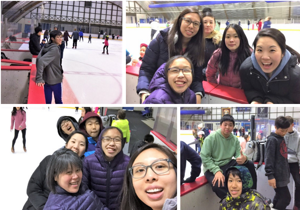
牛頓堂青少年團契於3/23-3/24的週末一起去溜冰和在教會留宿過夜。