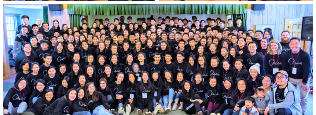
英文高中生青少年冬令會 (2/15-2/18)