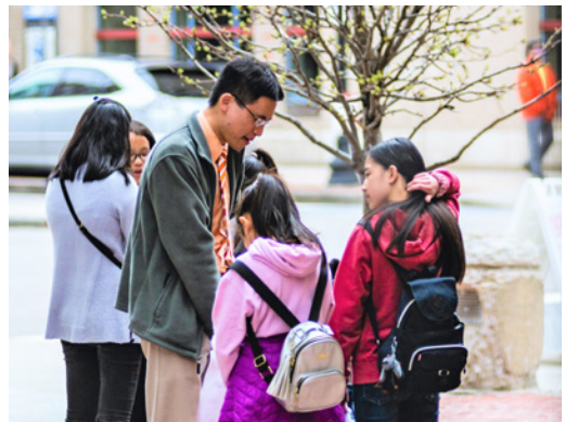
華埠堂及牛頓堂的步行祈禱 (4/12-4/14)