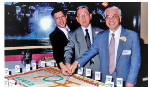
三位主任牧師於教會四十週年紀念晚宴（2001）