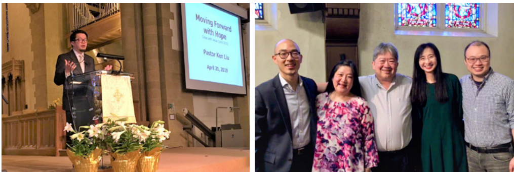
華埠英文堂及牛頓英文堂復活節主日崇拜 (4/21)