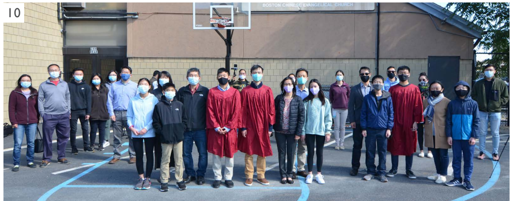
洗禮：1-3) 國語 (9/19) 4-7) 粵語 (9/20) 8-10) 英語 (9/20)