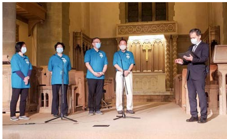
靠著神的恩典，培訓課程在2020年11月7日順利完成。學員和老師滿心歡欣！（口罩內藏微笑！）2020年11月14日差遣禮，四位學員正式成為司提反同工。