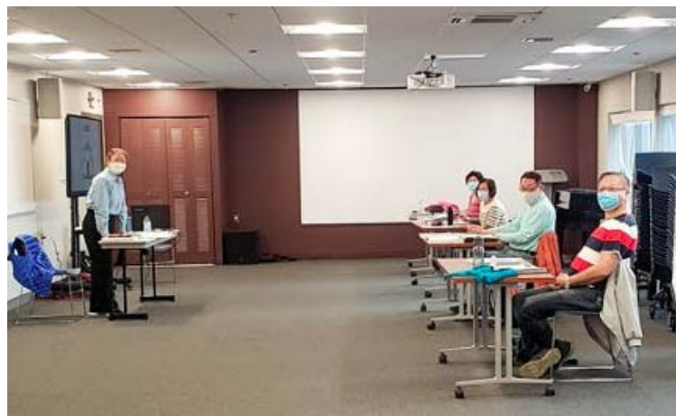
司提反培訓在疫情下上課。學員和老師都帶口罩並維持六呎社交距離。