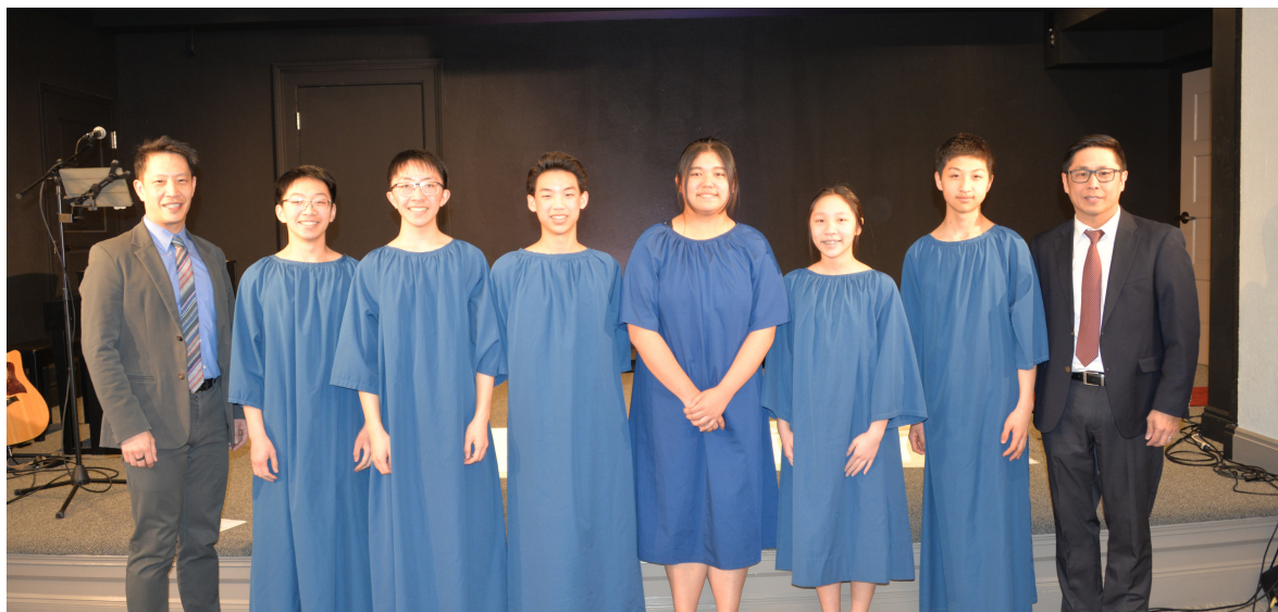
六位弟兄姊妹4月9日準備洗禮。（圖片來自華人佈道會）。