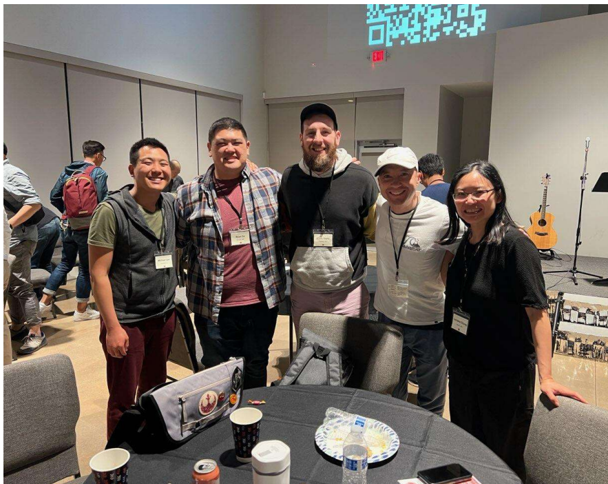
華人佈道會的教牧同工參加華人傳統教會牧者會議。