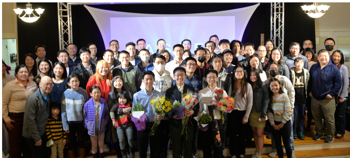
洗禮的弟兄姊妹及其家人合影留念。（圖片來自華人佈道會）。