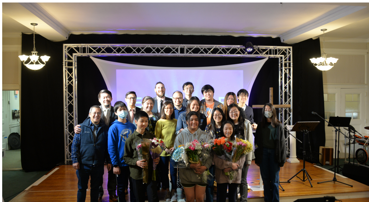
親朋好友於4月9日復活節合照留念。（圖片來自華人佈道會）。