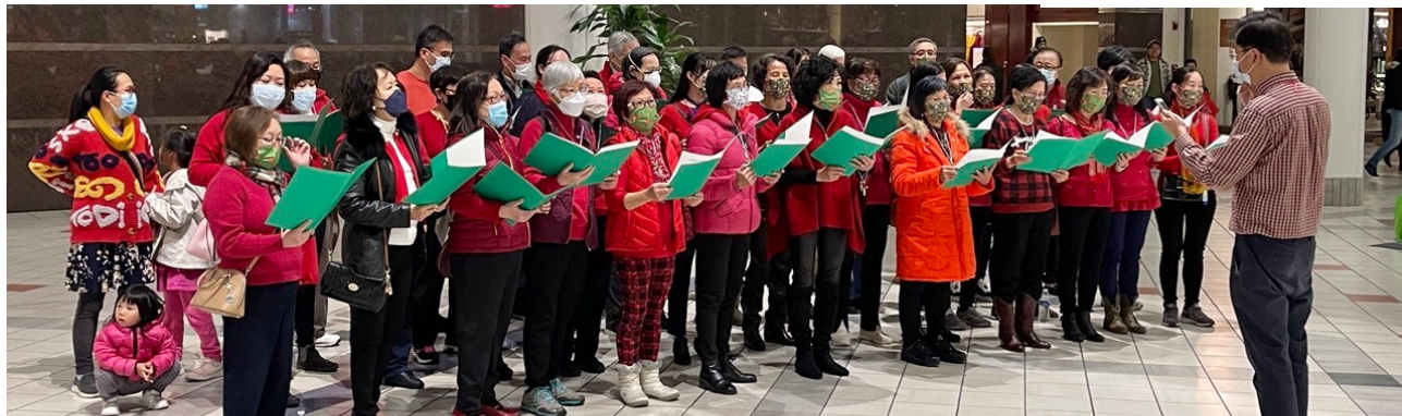
波士頓短宣佈道團2022年12月在South Shore商場報佳音。（圖片來自黃翰欣）。