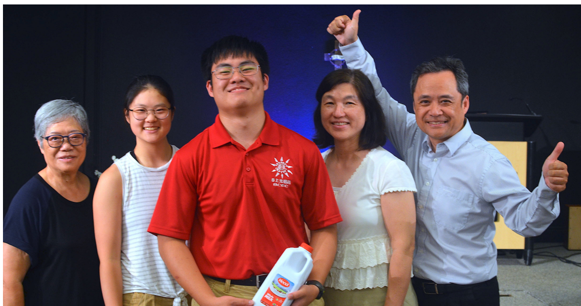
家人為洗禮的弟兄慶祝。（圖片來自華人佈道會）。